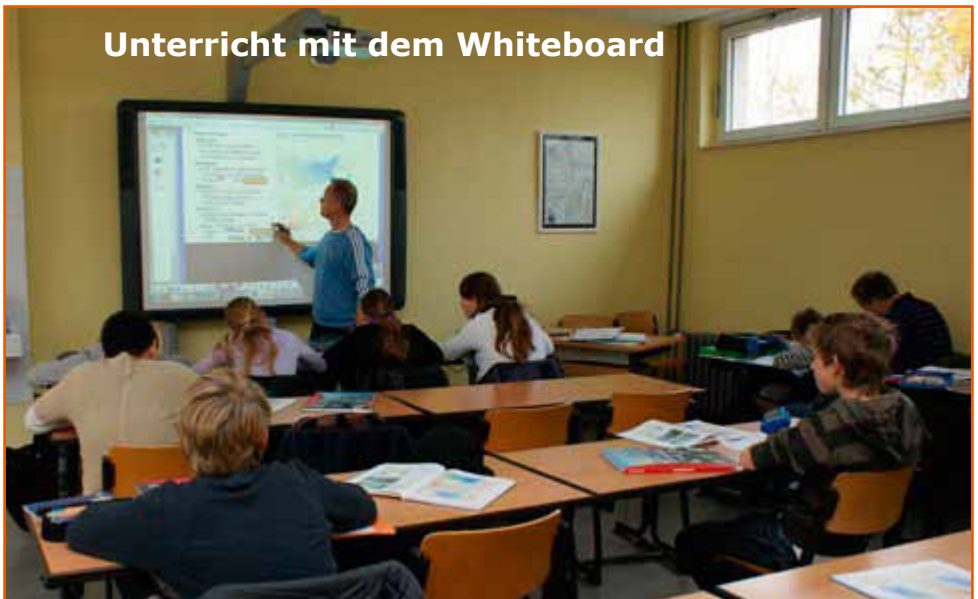
Unterricht mit dem Whiteboard